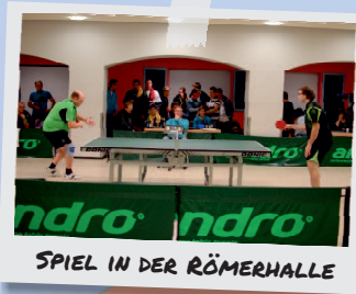
SPIEL IN DER RÖMERHALLE

Tischtennis bringt im Gegensatz zu vielen anderen Sportarten Aktive aller Altersklassen an der Platte zusammen. Das Training für den Nachwuchs findet in der Römerhalle während der Schulzeit donnerstags ab 17:30 Uhr statt. Die Erwachsenen und in den Herrenmannschaften spielenden Jugendlichen trainieren montags ab 20:00 Uhr und donnerstags ab 19:00 Uhr.