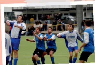
DIE FUßBALLER IM AUFWIND