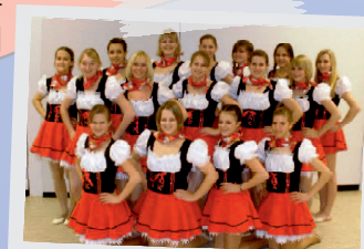
FRAUENPOWER AUF DEM PARKETT

Vor allem in der Fastnachtszeit zeigen die Tanzgruppen des TuS den Dichtelbachern und auswärtigen Gästen traditionell ihre hart einstudierten Tänze. Ob Youtelcreeks und Furious Project in der Vergangenheit oder Exeption, Bandinis und die Frechen Mädchen heute - die TuS-Gruppen stehen für erstklassige Choreographien und mitreißende Shows. Für diese Qualität steht beispielsweise auch der 1. Platz beim 2. offenen Löhr-Toyota-Cup 2012 in Koblenz durch die Tanzgruppe Exeption.