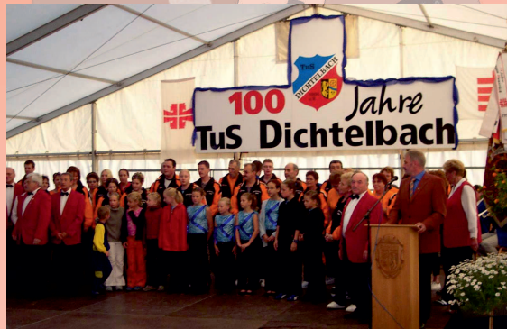
Verein(t): Gruppenfoto im Festzelt anlässlich der 100-Jahr-Feier 2004

Unterstützungen in Form von Arbeitskraft, Sach- oder Geldspenden sind uns jederzeit herzlich willkommen!